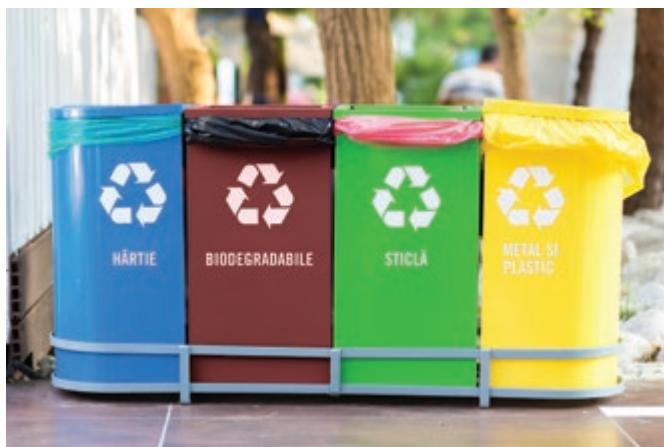
Coșuri de colectare selectivă

Cum ne organizăm? Într-un colț al bucătăriei amenajăm spațiul de colectare selectivă a deșeurilor. Există pe piață coșuri special create pentru această acțiune precum cele din imaginea alăturată. Ele ne ajută să separăm hârtia și cartonul, plasticul și metalul, sticla și gunoiul menajer (deșeuri biodegradabile și nereciclabile). Dacă nu avem astfel de coșuri sau suficient spațiu pentru ele, putem folosi mai mulți saci de gunoi.